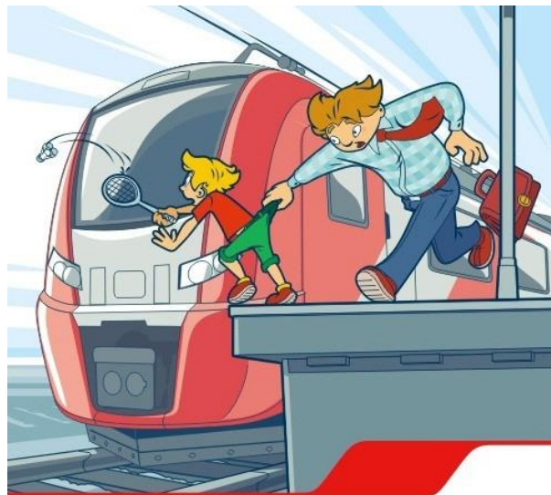
Платформа – не место для игр!