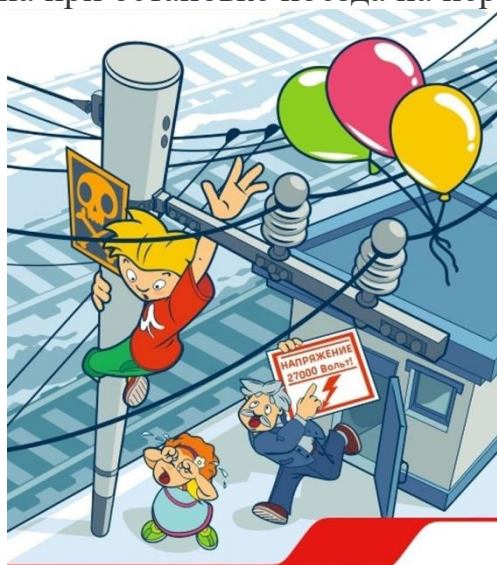
Приближаться к проводам меньше чем на 2 метра – смертельно опасно!